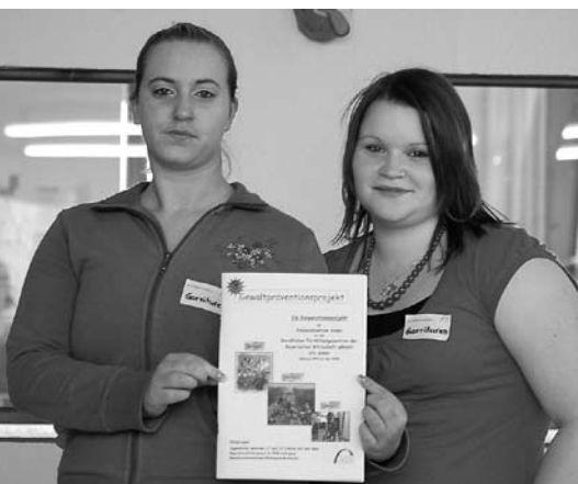
Präventionskurs: Konfliktlösung trainiert

Ein Plakatwettbewerb zum Thema Gewalt, Verkehrssicherheitstraining für Fahranfänger, Rollenspiele und weitere erlebnisintensive Elemente ließen die anfängliche Skepsis der Teilnehmer rasch in Begeisterung umschlagen. Zwei von ihnen haben nun „Polizist“ als Berufswunsch. Sogar das Stuttgarter Innenministerium zeigte Interesse am Aalener Konzept.