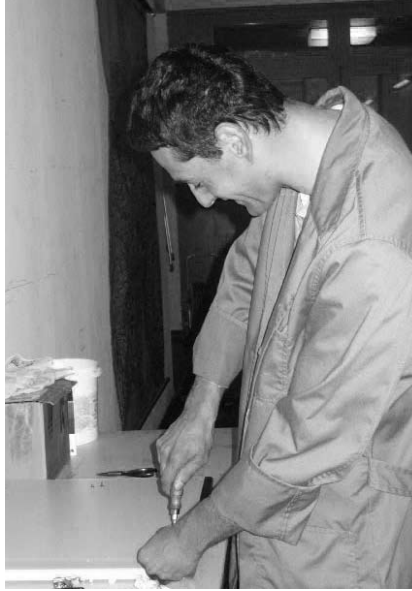
PPB-Teilnehmer: Umgehend starten

Es beginnt am Tag nach der Antragstellung mit einer zehntägigen Arbeitserprobung in einem der Praktikumsbetriebe. Je nach persönlichen