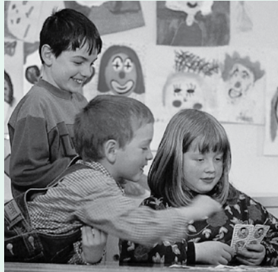
Hyperaktivität: Belastet Kinder wie Familie

Aufmerksamkeitsdefizite bei Kindern und Jugendlichen treten häufig zu-