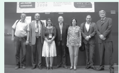
Bayerische Kongress-Delegation: Umweltkompetenz für Brasilien

jekts fand im April in Recife der Kongress „Citaes 2008“ über nachhaltiges und ökologisches Bauen statt. Referenten des bfz und aus der öffentlichen Verwaltung Bayerns berichteten über neueste Erkenntnisse.