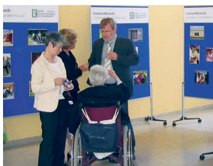
Rehabilitation: Kongress gibt Anstöße

Seit 100 Jahren organisiert die Deutsche Vereinigung für Rehabilitation den interdis-