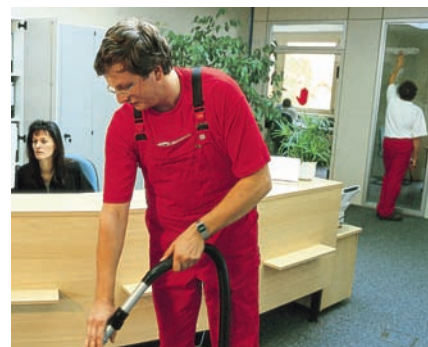
Gebäudereinigung: Integrationsfirma behauptet sich

Mit einer sechs Mitarbeiter starken Abteilung für Gebäudereinigung trat das bfz 1997 in den Markt ein. Heute ist daraus die Integrationsfirma win gGmbH geworden, die ca. 140 Mitarbeiter beschäftigt, davon etwa 60% mit Behinderung. Sie werden tariflich entlohnt und sorgen für saubere Räume und Fenster in Büros, Schulen, Werkstätten und Wohnheimen in Unter- und Oberfranken, Oberbayern sowie im angrenzenden Sachsen. Zudem erledigt win im Auftrag anderer Unternehmen der bbw-Gruppe die Personalsachbearbeitung für Sondergruppen wie Rehabilitanden. ■