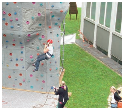
Jubiläumsfeier: Neue Zukunftsperspektiven

Krankheits-, alters- oder behinderungsbedingte Einschränkungen der Bewegungsfähigkeit wie der Sinneswahrnehmung, aber auch die Prävention sind das Metier der Ergotherapeuten. Seit 1999 bildet die Berufsfachschule Rosenheim in 36 Monaten Vollzeitunterricht Ergotherapeuten aus. Ihr zehnjähriges Jubiläum feierte die Schule im Mai mit zahlreichen Gästen und ehe-