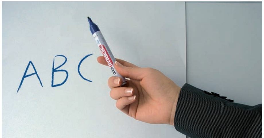
Berufsorientierte Grundbildung: Vorbereitung auf den ersten Arbeitsmarkt

Auch Jobs für Geringqualifizierte setzen eine Grundbildung voraus, über die Millionen Deutsche nicht verfügen. Das bfz Nürnberg will mit dem f-bb für Abhilfe sorgen.