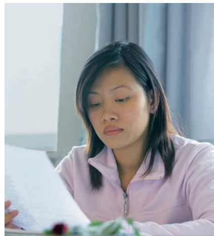
Sprachbarrieren überwinden: Bessere Chancen

Für alle der elf vom BAMF festgelegten Fördergebiete in Bayern hat das bfz den Zuschlag als Projektträger erhalten und ist