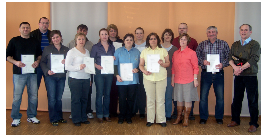
Erfolgreiche Prüfung: Alle 15 Teilnehmer erhielten ihr Zertifikat

Im beruflichen Alltag angemessen kommunizieren zu können, ist ein wesentlicher Schritt für Menschen mit Migrationshintergrund zur beruflichen wie gesellschaftlichen Integration. Das bfz Schweinfurt verknüpft daher Sprach- mit Fachunterricht und betrieblichen Praktika.