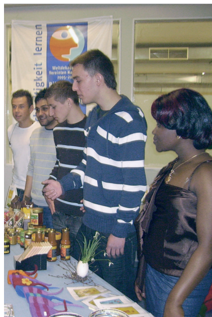
Fair gehandelte Produkte: Verkauf in München

Nahezu jeder Arbeitsplatz weist einen globalen Bezug auf – und sei es nur dadurch, dass ein Werkzeug auf einem anderen Kontinent produziert wurde oder Rohstoffe und Endprodukte aus anderen Weltregionen kommen. Für die Internet-Generation spielen Entfernungen kaum noch eine Rolle, ein Mausklick holt jeden Winkel der Erde auf den Bildschirm. Das Verstehen globaler Zusammenhänge, interkulturelle Sensibilität und Weltoffenheit sind indes keine zwangsläufigen Folgen ausgiebigen Surfens. Hier setzt