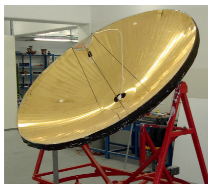
Parabolspiegel: Bündelung der Sonnenenergie

Auf dem Dach der Ridlerstraße 73, einer Adresse des bfz München, wird demnächst ein Parabolspiegel stehen. Mit Fachleuten, die auf dem Stand der aktuellen technischen Gegebenheiten sind, lassen sich dieses Alternativenenergie-Projekt sowie andere innova-