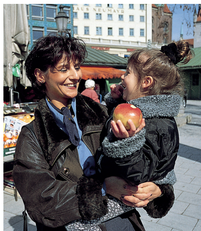
Mutter und berufstätig: schwierig, aber machbar