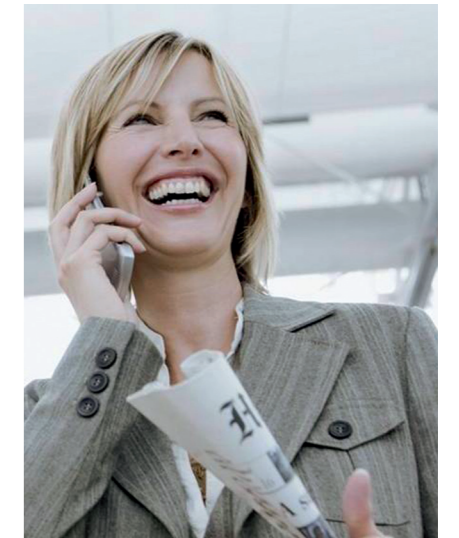
Frauenprojekt: Führung und Einfluss

Das Interesse der Unternehmen an der Teilnahme war erfreulich hoch, so dass das Projekt im Juli 2010 mit 61 Teilneh-