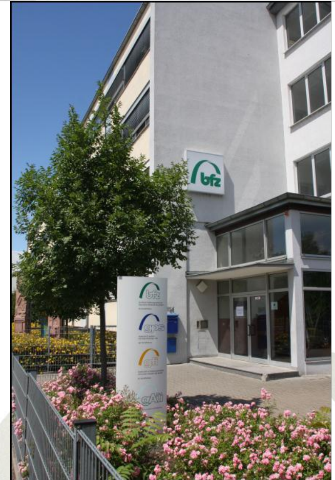
Trainings- und Schulungszentrum