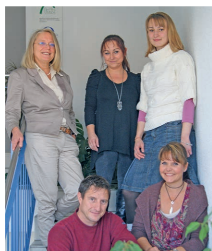
Weilheimer Dozenten: Kurse hinter Gittern