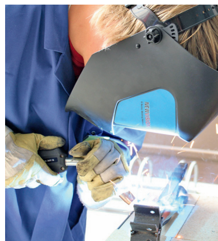
Metallberuf: Jugendliche im Schnupperkurs

Teil der Bildungsoffensive der bayerischen Metallarbeitgeber zur Fachkräftesicherung ist das Projekt „power(me)“. Es wendet sich an Jugendliche, die aufgrund ihrer schulischen Leistung und Sozialkompetenz ansonsten kaum eine Chance auf einen M+E-Ausbildungsplatz hätten. Das Projekt wird vom bbw durchgeführt und von der Bundesagentur für Arbeit mitfinanziert. Power(me) schließt ein fünftägiges Sommerncamp im Bayerischen Wald ein, in dem sich lernschwache Jugendliche vor Beginn der Lehre auf eine technische Ausbildung vorbereiten. Sie sollen sich ihrer Stärken bewusst werden und Gemeinschaft erleben. ■