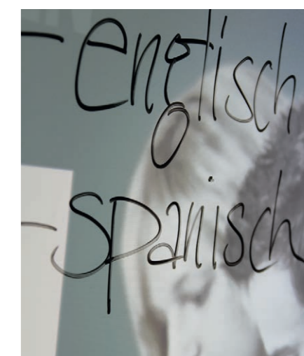
Fremdsprachen: Ausbildung in Nürnberg

zudem weltweit beste Berufsperspektiven in Wirtschaft und Verwaltung. Ein mittlerer Bildungsabschluss, Interesse, Talent und Englischkenntnisse auf dem Niveau der Mittleren Reife vorausgesetzt, vervollkommen Berufsanfänger und Wiedereinsteiger ihr Englisch. Die zweite Fremdsprache ist Spanisch, Vorkenntnisse sind nicht erforderlich. Zusätzlich bietet die Schule das Erlernen der französischen Sprache an. Zur Vorbereitung auf die spätere Tätigkeit sind Informations- und Kommunikationstechnik sowie Grundlagen der Betriebs- und Volkswirtschaft Teil der Ausbildung, ebenso Fach-, Sozial- und Auslandskunde und, nicht zuletzt, Deutsch. www.fremdsprachenschule-nuernberg.bfz.de ■