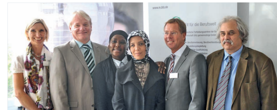
Intelligente Lösung gefunden: Verantwortliche aus München mit Teilnehmerinnen

Händeringend gesuchte Kinderpflegerinnen und -pfleger auszubilden und dabei Teilnehmer aus dem großen Reservoir Geringqualifizierter zu rekrutieren, gelang der Agentur für Arbeit München und dem örtlichen bfz.