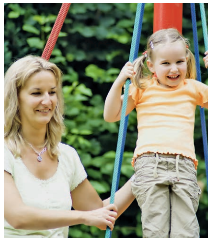
Benachteiligt: Mütter ohne Partner