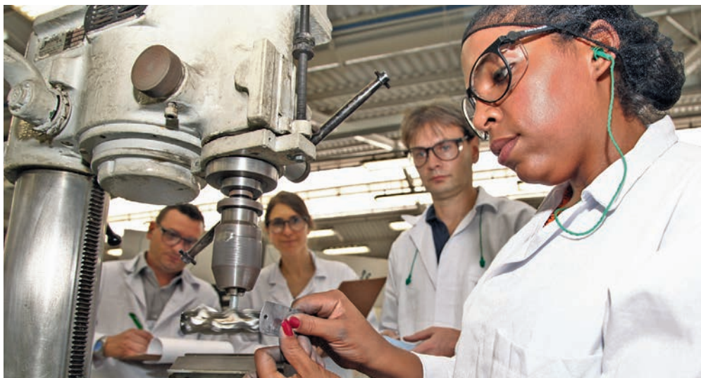
Chance für die Ärmsten: Eignungstest