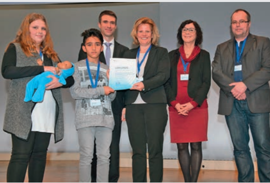
Für Berufsorientierung ausgezeichnet: bfz-Team