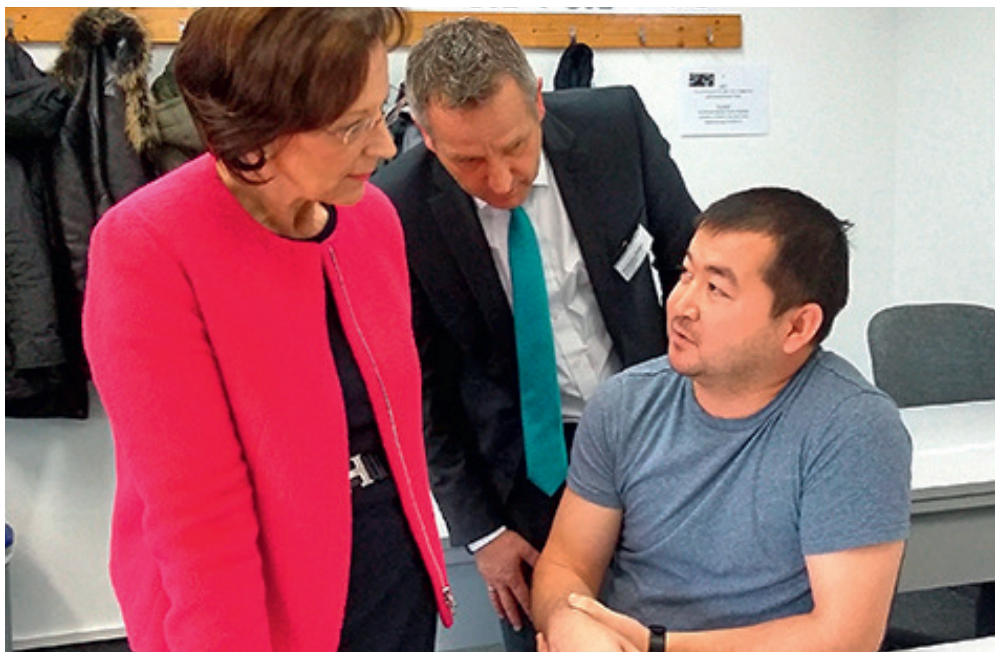
Emilia Müller informiert sich vor Ort: bfz-Projekt ist vorbildlich

Nach vier Monaten Projektlaufzeit zog die Staatsministerin für Arbeit und Soziales, Familie und Integration, Emilia Müller, eine positive erste Bilanz. Dabei hob sie die Beratung von Arbeitgebern sowie die Nachbetreuung der Teilnehmer nach erfolgreicher Vermittlung hervor: „Solche ganzheitlichen Projekte wie SCI sind im Hinblick auf den Fachkräftebedarf auch eine große Chance für die Wirtschaft.“ ■