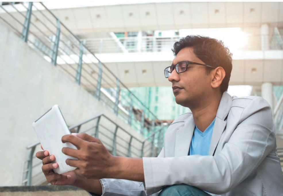
Mitentscheidend für die Zukunft Indiens: Berufliche Bildung