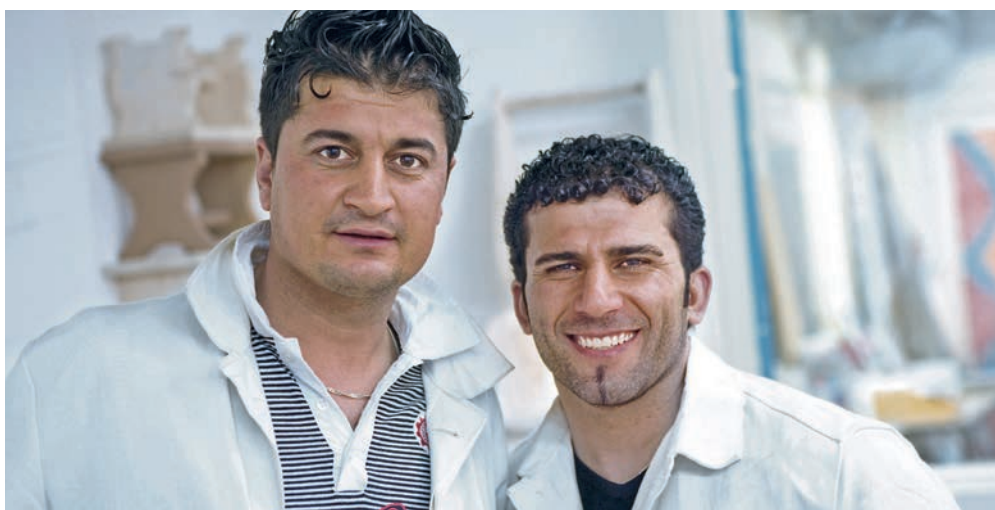
Integrationsförderung: Brose Fahrzeugteile engagiert sich

Ziel des Brose-Projekts ist eine fundierte Berufsorientierung, die in eine Berufsausbildung, ein Studium oder direkt in eine Arbeitsaufnahme münden kann. Sechs Monate sind 30 Flüchtlinge und anerkannte Asylbewerber im Alter von 18 bis 25 Jahren dafür im bbw. Teilnahmevoraussetzungen sind einfache Deutschkenntnisse sowie die Motivation zu beruflicher und sozialer Integration. Mit berufsbezogenem Deutschunterricht, fachlicher Qualifizierung und zwei einmonatigen Betriebspraktika wird die Basis für einen Berufseinstieg in Deutschland gelegt. Das bbw unterstützt auch bei der Übersetzung von Zeugnissen und deren Anerkennung und steht allen Beteiligten – Flüchtlingen, Paten und dem Unternehmen Brose – als Ansprechpartner zur Verfügung. ■